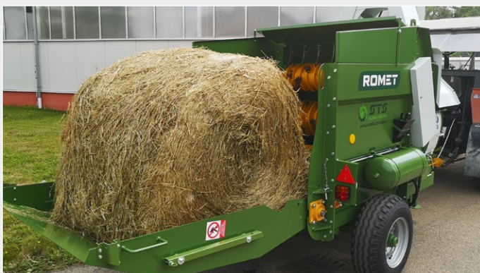
Rozdružuje i balíky těžké senáže