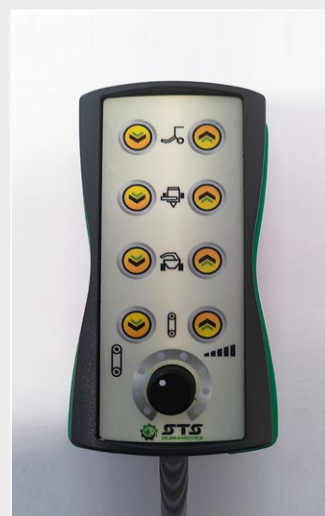
Dálkový ovladač pro snazší ovládání