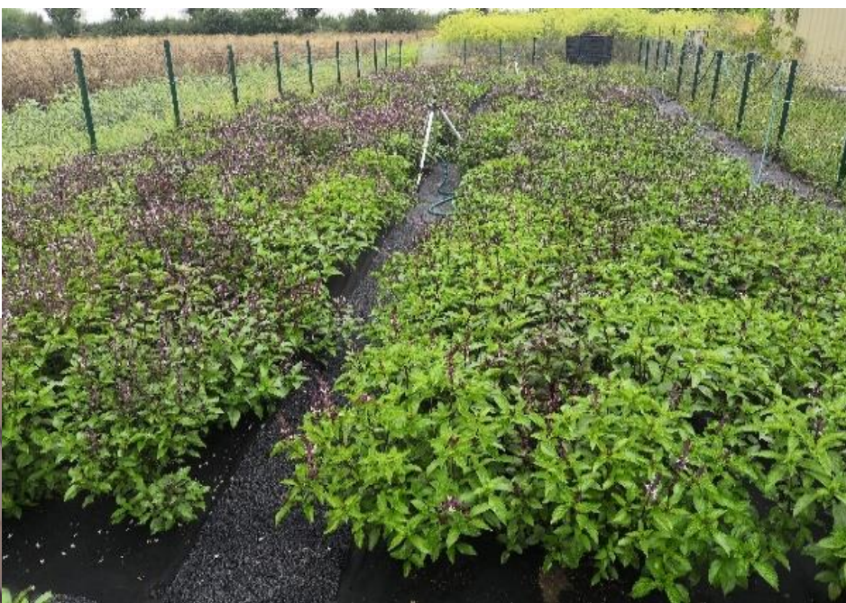
Sklizeň bazalky posvátné