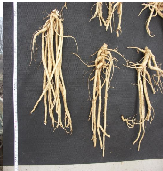
Sklizeň kořenů kozince blanitého